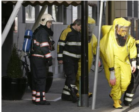
Volgens de brandweer lijkt het chloorlek in het hotel in Maastricht te zijn ontstaan doordat bij werkzaamheden verschillende stoffen met elkaar zijn gemengd.

MAASTRICHT (ANP) - Het chloorlek in een hotel in Maastricht lijkt te zijn ontstaan doordat bij werkzaamheden verschillende stoffen met elkaar zijn gemengd. Dat zei een woordvoerder van de brandweer woensdag. Dit zou gebeurd zijn in de kelder van het pand, waar gewerkt werd aan het zwembad.